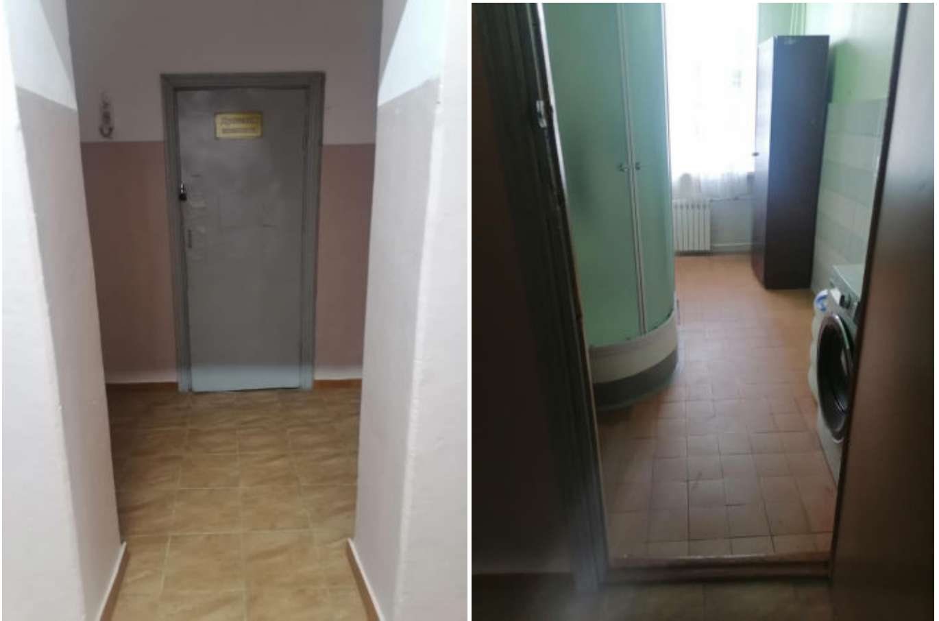
Рис. 15 Вход в душевую