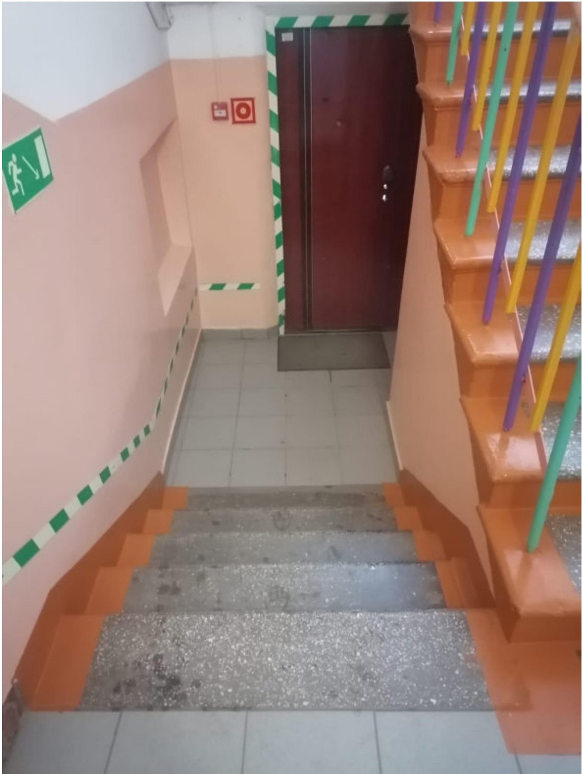
Рис .10 Путь эвакуации