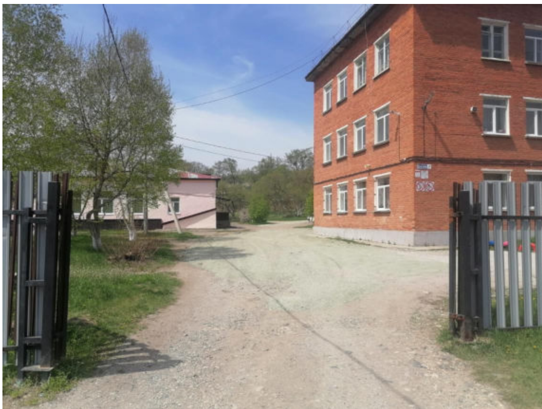
Рис.1 Центральные ворота