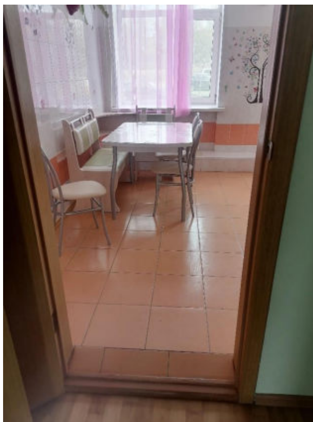
Рис.13 Обеденная зона