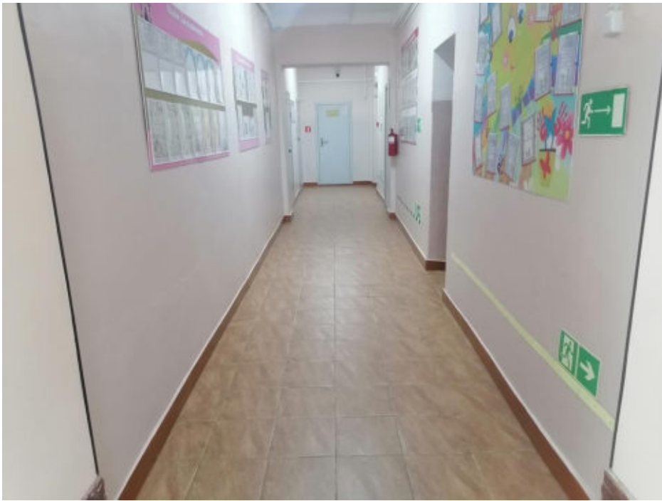
Рис. 8 Коридор (холл)