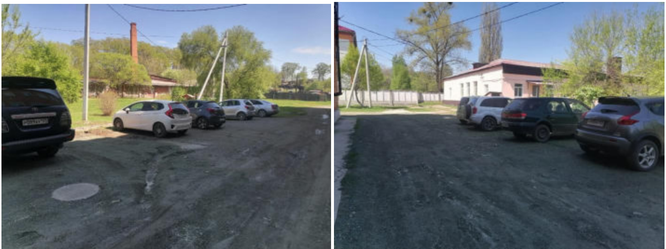
Рис. 4 Автостоянка