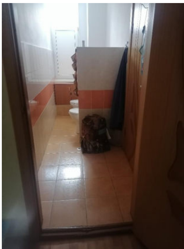
Рис.14 Ванная комната и туалет