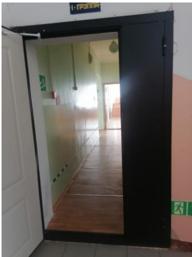
Рис.12 Вход в группу