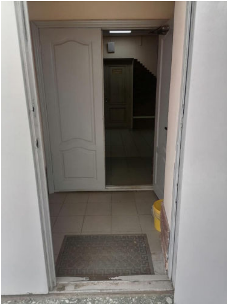
Рис. 7 Тамбур