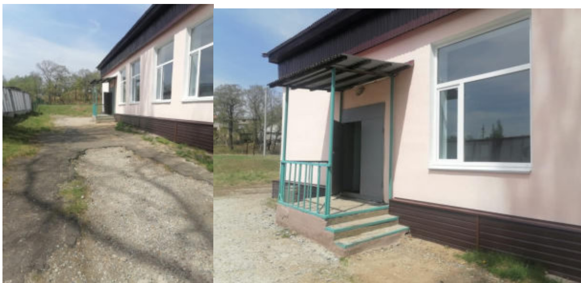
Рис 2 Вход в столовую и наружная лестница