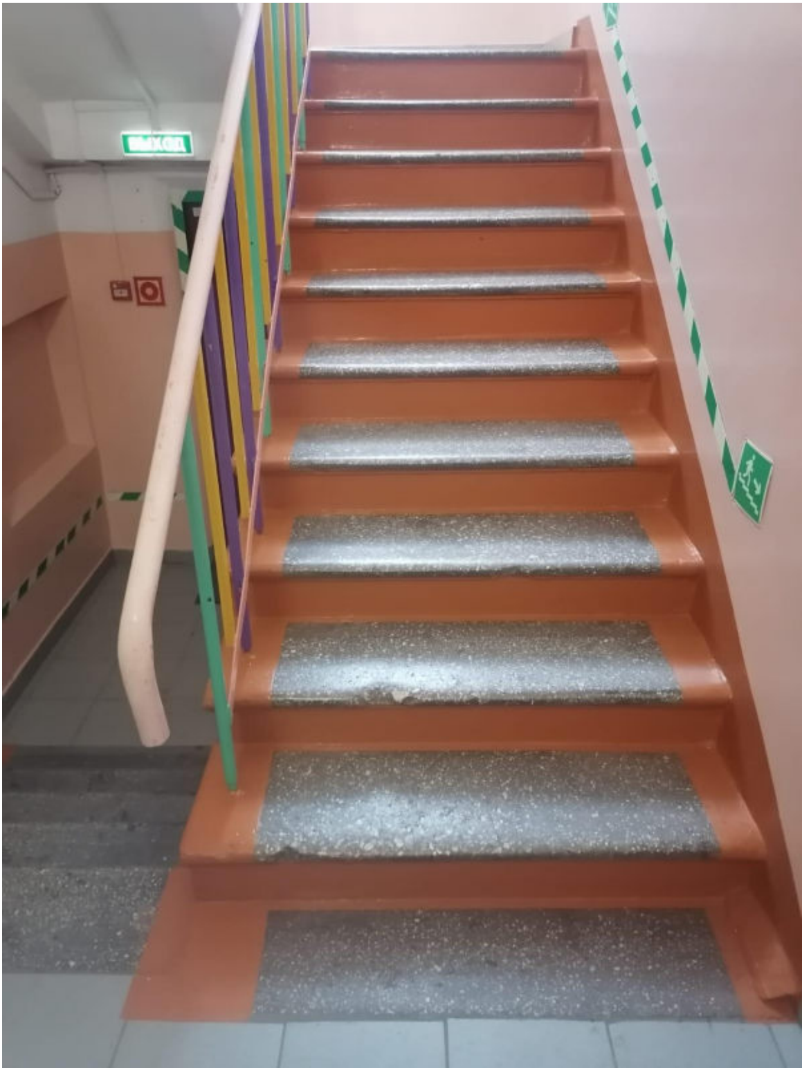
Рис. 9 Лестница внутри здания