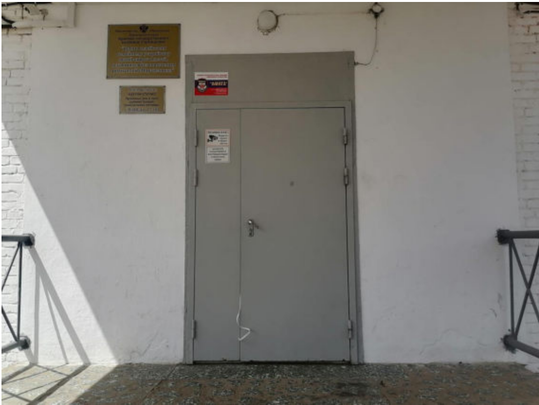
Рис.6 Входная дверь