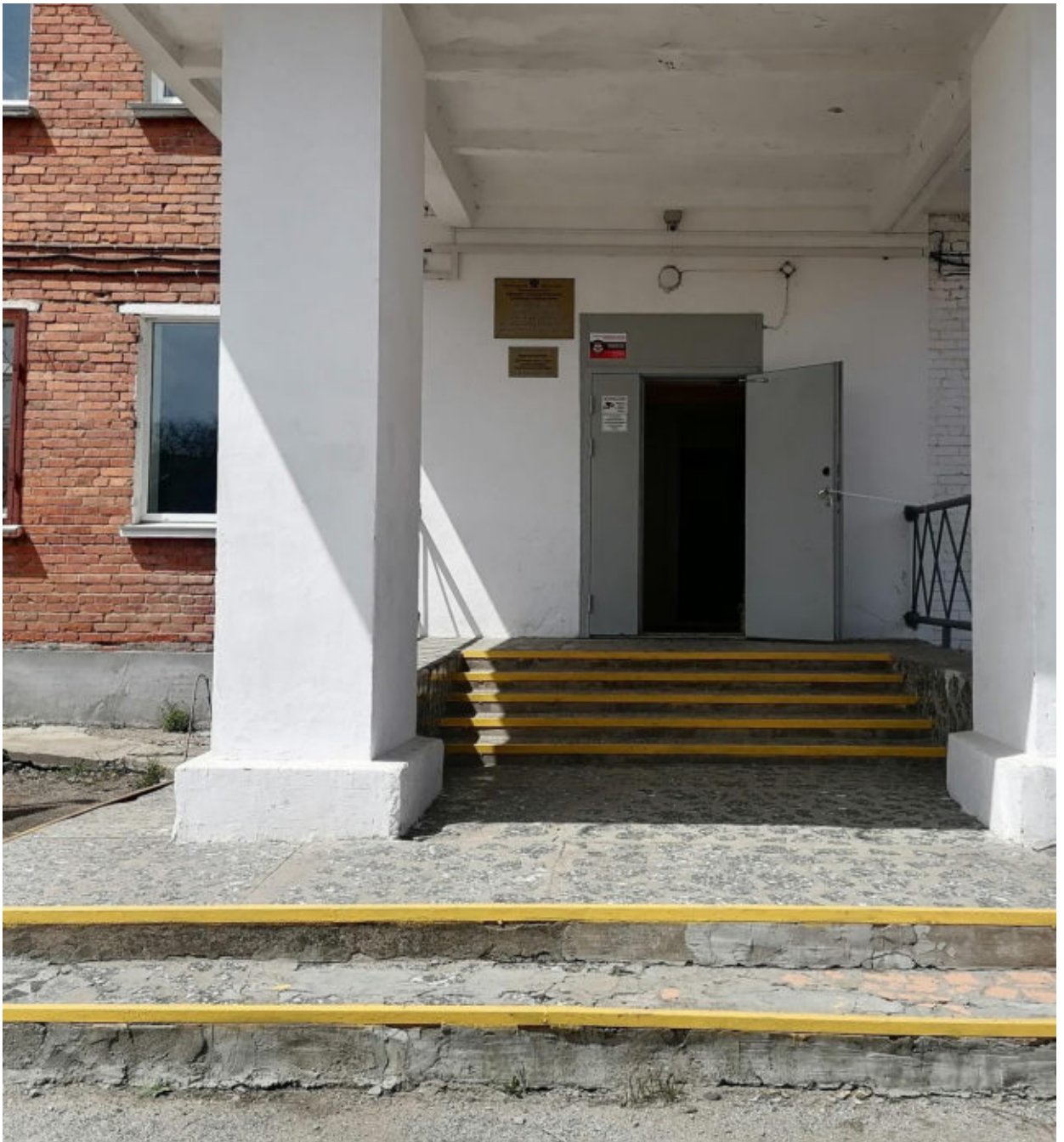
Рис.5 Входная площадка