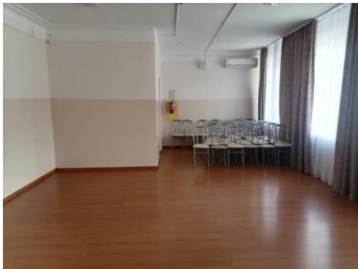
Рис. 11 Зальная зона (Актовый зал)