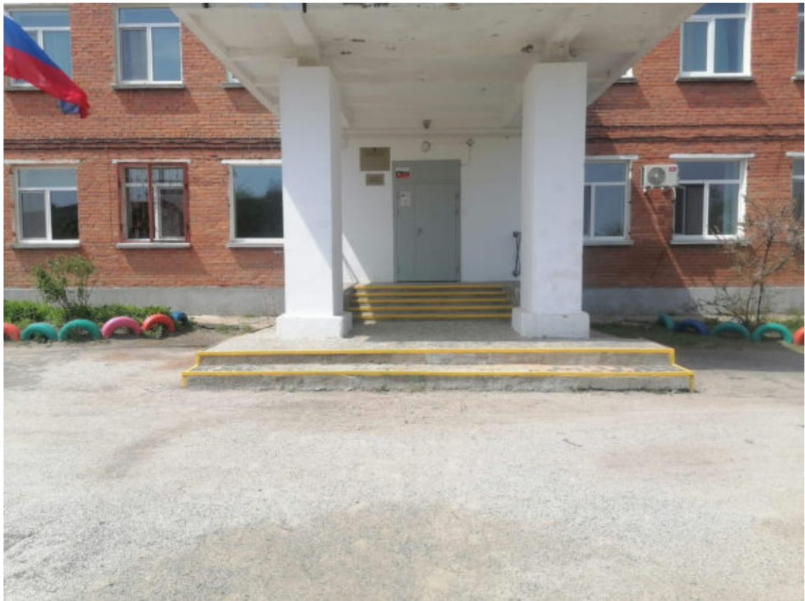
Рис. 3 Вход на территорию и наружная лестница