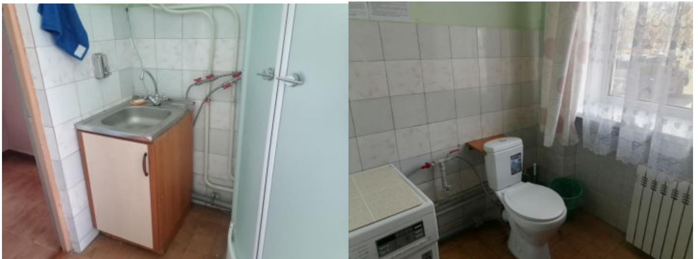
Рис. 16 Душевая